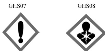
Rys. 1. Kody hasła ostrzegawczego „Niebezpieczeństwo”. Piktogramy określone w rozporządzeniu WE nr 1272/2008 (CLP) mają czarny symbol na białym tle z czerwonym obramowaniem, na tyle szerokim, aby było wyraźnie widoczne

H412: działa szkodliwie na organizmy wodne, powodując długotrwałe zmiany.