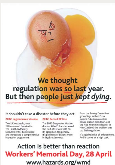
Fot. 2. Plakat promujący Międzynarodowy Dzień Pamięci