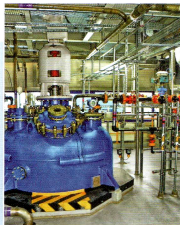
Okladka: fot. Janusz Serafin

Istota sporu sprowadzała się do rozstrzygnięcia, czy niepodporządkowanie służby bhp bezpośrednio pracodawcy lub osobie wchodzącej w skład organu zarządzającego u pracodawcy stanowi przedmiot regulacji nakazowej inspektora pracy i czy przyjęcie rozwiązań organizacyjnych w skarżącym podmiocie narusza przepisy bezpieczeństwa i higieny pracy.