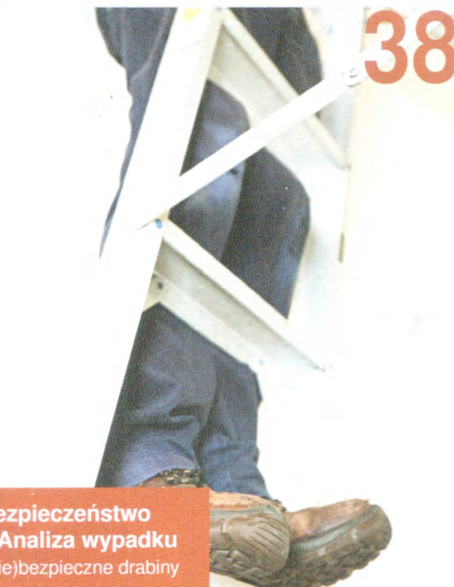
Bezpieczeństwo – Analiza wypadku (Nie)bezpieczne drabiny