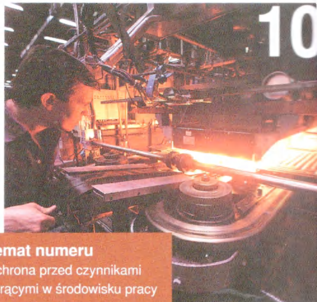
Temat numeru Ochrona przed czynnikami gorącymi w środowisku pracy