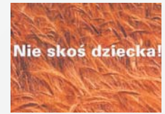
Fot. 2. Elżbieta Skrzypek. Archiwum CIOP-PIB