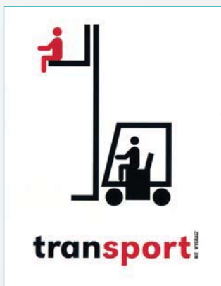
Fot. 1. Aleś Pokorný. Archiwum CIOP-PIB

Plakaty bezpieczeństwa pracy mają uświadamiać zagrożenia, które mogą wystąpić w środowisku pracy. Ich rola prewencyjna polega więc na przewidywaniu tego, co może nas dotknąć i wywołać niepożądane i bolesne skutki. Dzięki tej świadomości można zmienić podejście do pracy i życia. Szczególnie, gdy w wyniku wieloletniej pracy nabywa się wielu – często mogących stanowić dla nas zagrożenie – przyzwyczajeń bądź zachowań, które z zasady niebezpieczne, stają się normą (patrz plakat „Transport” – fot. 1.). W tym wypadku rolę plakatu jest uświadomienie tych przyzwyczajeń, co daje możliwość walki z nimi.