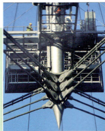
Okładka: fot. Waldemar Spólnicki