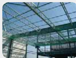
Fot. 9. Siatki bezpieczeństwa w układzie „S”