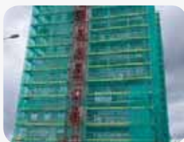
Fot. 3. Rusztowanie z siatką bezpieczeństwa