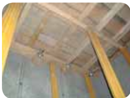
Fot. 11. Tymczasowy podest w szybie windowym