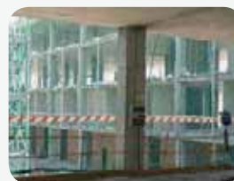
Fot. 4. Balustrada z siatką bezpieczeństwa