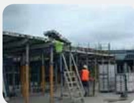
Fot. 8. Montaż szalunku pod konstrukcją żelbetową – metodą „od spodu”