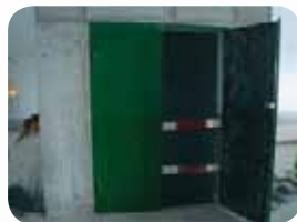
Fot. 12. Zabezpieczenie poprzeczne wejścia do szybu windowego