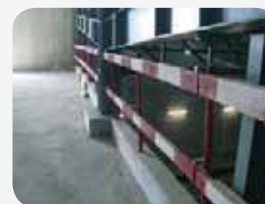
Fot. 5. Balustrada ze słupkami stalowymi