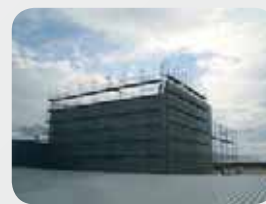
Fot. 10. Rusztowanie elewacyjne