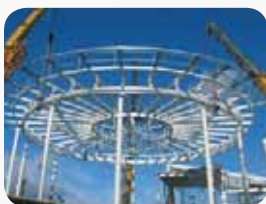
Fot. 1. Montaż konstrukcji stalowej przygotowanej wcześniej na poziomie gruntu