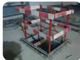
Fot. 13. Zabezpieczenie otworu