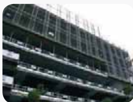
Fot. 2. Ekran zapewniający jednoczesną ochronę na wielu piętrach