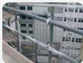
Fot. 6. Balustrada ze stalowymi słupkami, poręczą i poprzeczką