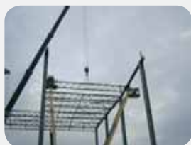
Fot. 7. Montaż konstrukcji stalowej