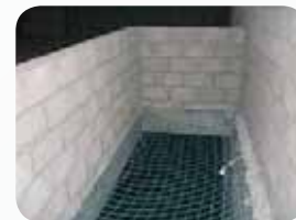
Fot. 14. Siatka bezpieczeństwa na co 2. poziomie