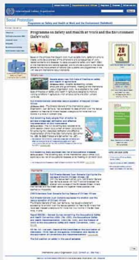
Rys. 2. Strona główna witryny działu „SafeWork”

Fig. 2. The main page of the „SafeWork” website