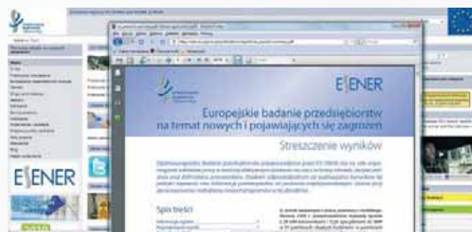
Rys. 1. Streszczenie raportu Agencji nt. europejskiego badania przedsiębiorstw w jęz. polskim Fig. 1. Abstract of the Agency report on the survey of European enterprises in Polish

Raport Agencji [5] prezentujący metodologię oraz pierwsze wyniki badań opublikowano w angielskiej wersji językowej w formie drukowanej oraz elektronicznej na stronach internetowych w dziale Publikacje ( http://osha.europa.eu/pl/publications ). Streszczenie najważniejszych wyników raportu zostało również opracowane i udostępnione w witrynie w wersjach językowych UE, m.in. w jęz. polskim (rys. 1.), [6]. Publikacje udostępnione w witrynie można pobrać bezpłatnie w formacie pdf. Narodowe wersje językowe rozpowszechniano także w formie drukowanej, m.in. za pośrednictwem krajowych punktów centralnych. W witrynie Agencji, na stronach Europejskiego Obserwatorium Ryzyka zamieszczono także interaktywne narzędzie (w językach urzędowych UE), prezentujące szczegółowe wyniki badania przedsiębiorstw (rys. 2.).