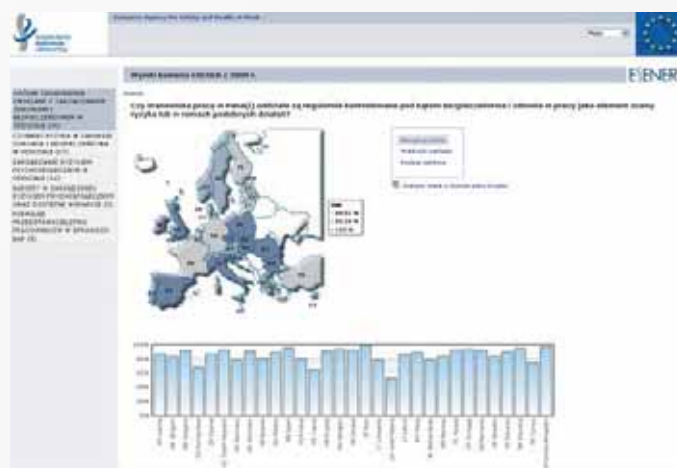
Rys. 2. Interaktywne narzędzie ( http://osha.europa.eu/sub/esener/pl ) prezentujące wyniki europejskiego badania przedsiębiorstw na temat nowych i pojawiających się zagrożeń Fig. 2. Interactive tool presenting results of the survey of European enterprises on new and emerging risks

Agencja zajmuje się również popularyzacją wyników badań, w co włącznie są jej krajowe punkty centralne, również polski Krajowy Punkt Centralny (CIOP-PIB). W październiku br. w Katowicach odbyło się seminarium: „ESENER. Nowe i pojawiające się zagrożenia psychospołeczne w środowisku pracy”, z udziałem przedstawiciela Agencji, kierującego pracami Europejskiego Obserwatorium Ryzyka. Celem spotkania była popularyzacja wyników badania w środowisku krajowym. Podobne spotkania z udziałem przedstawiciela Agen-