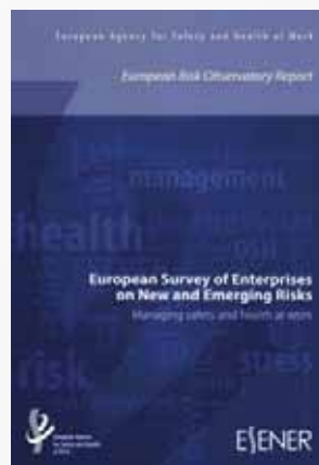
Fot. 4. Raport Agencji oraz interaktywne narzędzie ( http://osha.europa.eu/sub/esener/pl ), prezentujące wyniki europejskiego badania przedsiębiorstw na temat nowych i pojawiających się zagrożeń

Fot. 4. Agency report and an interactive tool presenting results of the European Survey of Enterprises on New and Emerging Risks