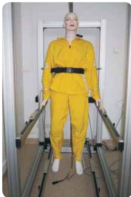
Fot. 2. Stanowisko do badania izolacyjności wynikowej Photo. 2. Test stand to measure resultant thermal insulation (dynamic, movable manikin)

zione pod ubraniem, powodując tym samym wtłoczenie „nowego” powietrza (tzw. efekt pompowania). Powoduje to wzrost wymiany powietrza z otoczeniem (np. przenikanie wiatru przez tkaninę). Im mniejsza prędkość powietrza, tym mniejsza utrata izolacyjności, natomiast ze wzrostem jego prędkości spada izolacyjność warstwy powietrza.