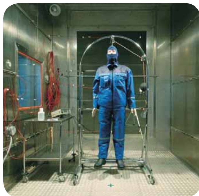
Fot. 1. Stanowisko do badania podstawowej izolacyjności cieplnej Photo. 1. Test stand to measure basic thermal insulation (static manikin)