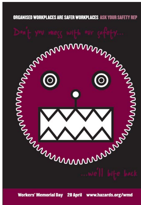
Rys 5 Plakat ITUC związany z Dniem 28 kwietnia