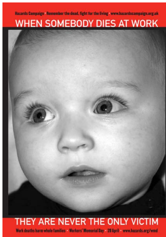
Rys 4 Plakat ITUC związany z Dniem 28 kwietnia