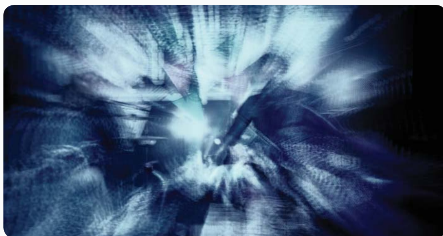
Fot. Ryan Smart

The presence of barrier's structure (reflecting or absorbing) between electromagnetic field source and protected object is the basic element for localizing shielding and covering shielding, as well as design of protective cloths against excessive exposure of workers to electromagnetic fields. Materials of barrier's structures, useful for protection against exposure to electric or magnetic fields of various frequencies were presented. Special attention was paid on materials of properties useful for design of protective clothes.