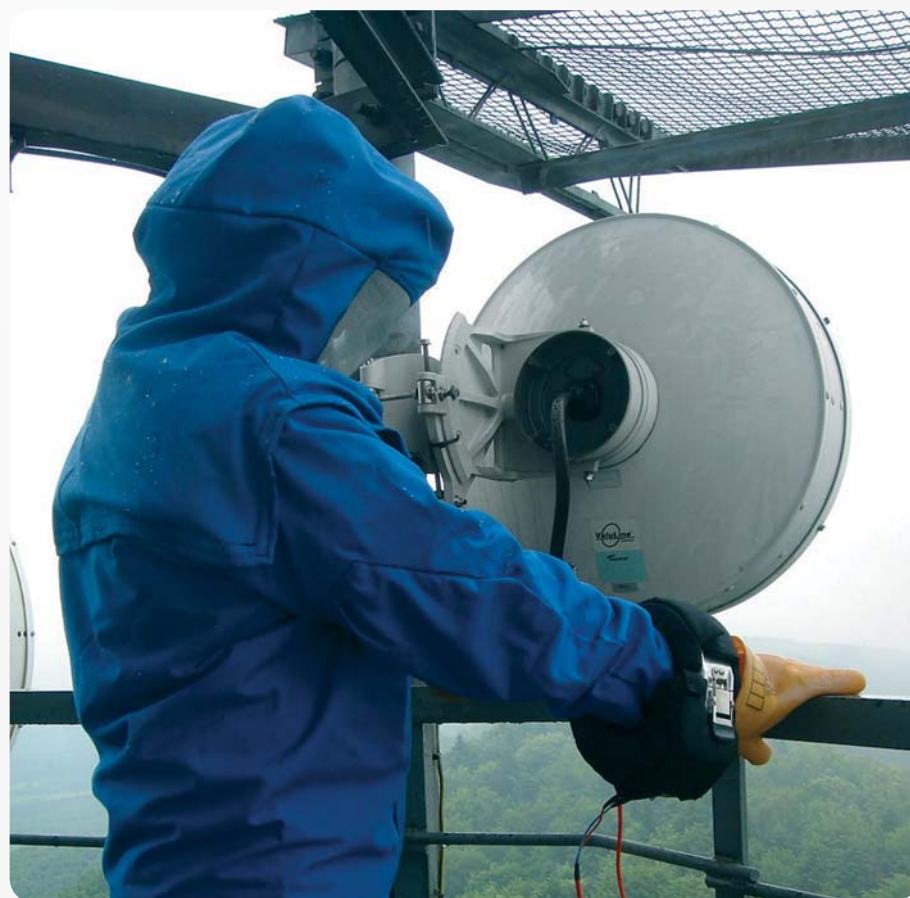
Ubiór chroniący przed promieniowaniem mikrofalowym, opracowany przez CIOP-PIB