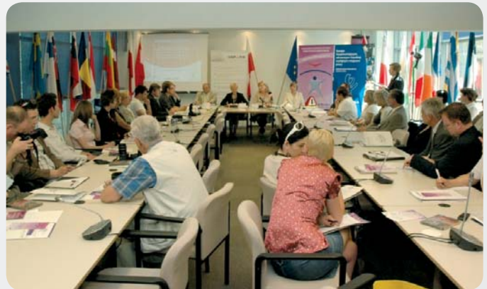
Photo 2. Press conference launching the Polish edition of the risk assessment information campaign (The Delegation of the European Commission, Warsaw, June 2008)

Fot. 2. Konferencja prasowa otwierająca polską edycję kampanii informacyjnej na rzecz oceny ryzyka zawodowego (Przedstawicielstwo Komisji Europejskiej w Polsce, Warszawa, czerwiec 2008)