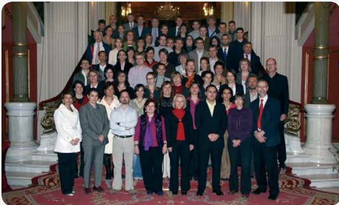
Photo 1. Employees of the European Agency for Safety and Health at Work ( http://osha.europa.eu )

Fot. 2. Konferencja prasowa otwierająca polską edycję kampanii informacyjnej na rzecz oceny ryzyka zawodowego (Przedstawicielstwo Komisji Europejskiej w Polsce, Warszawa, czerwiec 2008)