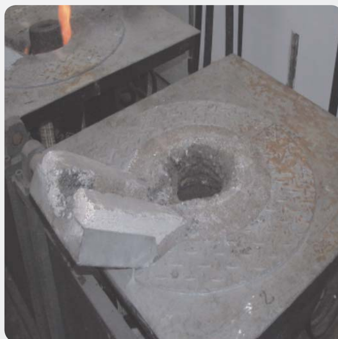
Fot. 2. Indukcyjny piec tyglowy