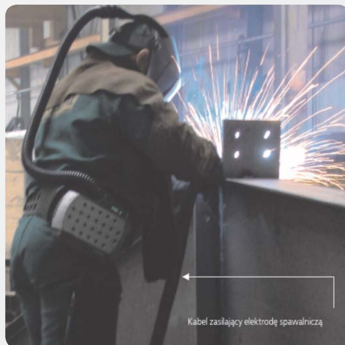
Fot. 4. Przykładowe wykorzystanie urządzenia spawalniczego Photo 4. Sample use of an arc welding device