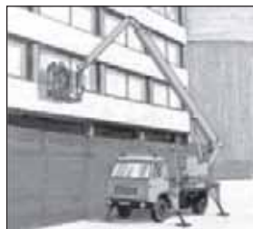
Rys. 1. Teleskopowy przejezdny podest ruchomy Fig. 1. A telescopic elevated mobile work platform

Stosowane są również podesty ruchome przejezdne , w których podnoszone stanowisko pracy (w koszu lub na pomoście z balustradą) znajduje się na końcu ruchomego wysięgnika (np. teleskopowego, nożycowego) mocowanego do przejezdnej platformy. Platforma ta może być ciągnięta przez inne maszyny lub mieć własny napęd (może to być także samochód ciężarowy). Wymagania dotyczące bezpieczeństwa użytkowania przejezdnych podestów ruchomych (rys. 1.) można znaleźć w rozporządzeniu ministra gospodarki [1] oraz normie [6].