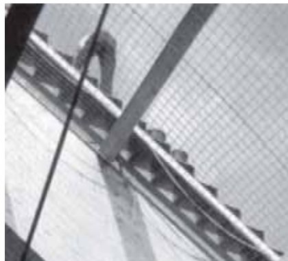
Fot. 7. Przykład wykorzystywania siatki bezpieczeństwa podczas robót na wysokości

Wymagania szczegółowe dotyczące parametrów technicznych siatek bezpieczeństwa (np. maksymalne odkształcenie i wysokość spadania, wielkość oczka, wysokość siatki nad podłożem oraz sposób jej mocowania) określają normy [16, 17].