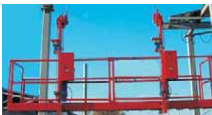
Fot. 1. Ruchomy podest zawieszony na linach Photo. 1. A cable moving work platform

nieprzejezdne (np. zawieszane na linach – fot. 1. – lub na masztach), których nie można przemieścić w kierunku poziomym bez ich demontażu. Podstawowe wymagania dotyczące bezpieczeństwa użytkowania tych urządzeń określono w rozdziale 8. rozporządzenia ministra infrastruktury [2], a szczegółowe wymagania bezpieczeństwa – w normach [4, 5].