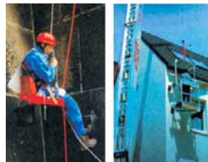
Fot. 2. Linowe urządzenie krzeselkowe

Wymagania bezpieczeństwa dotyczące linowych urządzeń ochronnych stosowanych do tego typu wyposażenia można znaleźć w normach [7, 8].