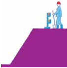
Fig. 5. A barrier used to protect against falling into an excavation

Zainstalowane balustrady powinny składać się z poręczy ochronnych umieszczonych na wysokości, co najmniej 1,1 m oraz krawężników o wysokości, co najmniej 0,15 m. Pomiędzy poręczą a krawężnikiem (w połowie wysokości) powinna być zamocowana poprzeczka lub przestrzeń ta powinna być wypełniona w sposób uniemożliwiający wypadnięcie osób. Wyjątkiem są balustrady w rusztowaniach systemowych, gdzie rozporządzenie ministra infrastruktury [2] dopuszcza umieszczanie poręczy ochronnej na wysokości 1 m.