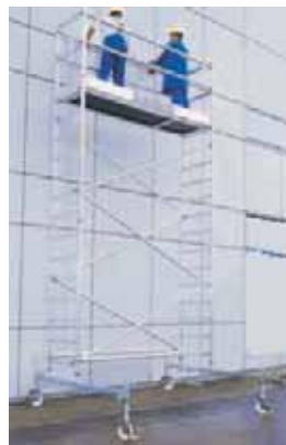
Fot. 4. Wykorzystywanie rusztowań jezdnych do prac wykończeniowych przy elewacji budynku

Rusztowania systemowe mają wymiary jednoznacznie określone przez połączenia umieszczane na stałe na elementach rusztowania – z uwzględnieniem sposobu przenoszenia obciążeń. Przykładem rusztowań systemowych są rusztowania modułowe (w których połączenia ze stojakami występują w stałych punktach węzłowych, rozmieszczonych w regularnych odstępach – modułach) i ramowe (o pionowej konstrukcji nośnej składającej się z prefabrykowanych płaskich ram). Typowe rusztowania systemowe montowane są zgodnie z instrukcją montażu i eksploatacji.