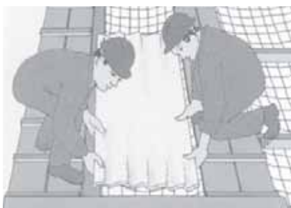
Rys. 3. Pokrywa na dachu o słabej wytrzymałości zastosowana w celu ochrony pracowników przed skutkami zawalenia się konstrukcji budowlanej

Mostki lub kładki zabezpieczające (rozkładające obciążenia na swojej powierzchni) są stosowane jako dodatkowa ochrona i układane głównie na dachach (rys. 3.) oraz innych powierzchniach w starych budynkach o słabej wytrzymałości. Powinny być zabezpieczone przed podnoszeniem i przemieszczaniem się, a ich powierzchnia powinna chronić stojących na niej pracowników przed poślizgnięciem się (np. przez zastosowanie mocowanych poprzecznych listew). Wymóg stosowania stałych lub przenośnych mostków i kładek zabezpieczających na dachach, których wytrzymałość nie zapewnia bezpiecznego przebywania na nich osób, określa rozporządzenie ministra infrastruktury [2].