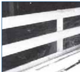
Photo 5. Wooden triple-guard side protection placed on the edge of a ceiling

Balustrady przy krawędziach dachów (fot. 6.) są także jednym ze środków ochrony stosowanym przed upadkami z wysokości [2].