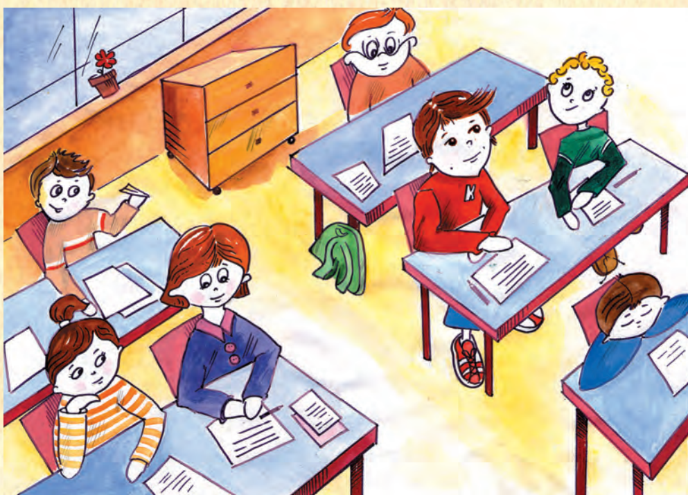
Ilustracja nr 6

Dzisiaj mam dobry dzień. Od rana pamiętam o zachowywaniu zasad bezpieczeństwa. Jestem ostrożny, uważam na to, co robię. Nie biegam tylko chodzę, nie rzucam przedmiotami tylko je podaję, nie biorę do ust żadnych przedmiotów, mam zawiązane sznurówki. Dlatego nic mnie dzisiaj złego nie spotkało, ani innych przeze mnie. Rozwiązując ćwiczenie dowiedcie się lepiej, jak wygląda moje dobre zachowanie w szkole. Powiem tylko, że jestem zadowolony.