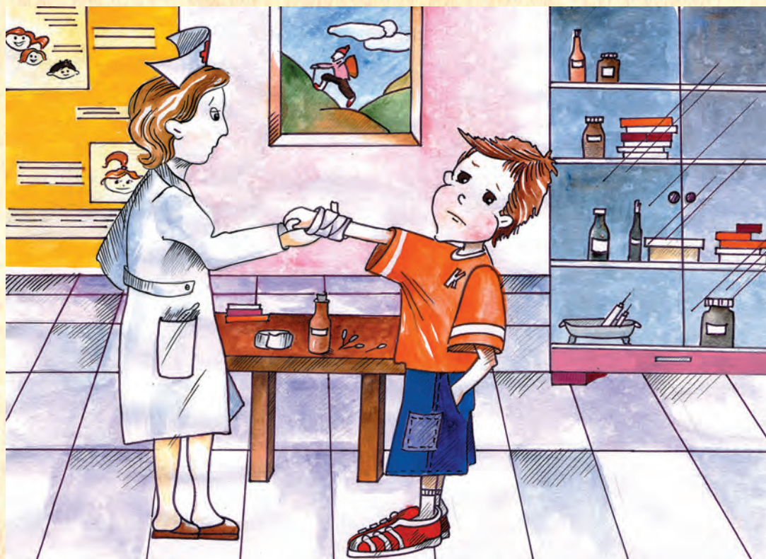
Ilustracja nr 7

Spójrzcie na mnie. Byłem dzisiaj w szatni i nie uważałem za bardzo, aby nie zrobić sobie krzywdy. Inni też nie uważali. A teraz mam zabandażowaną rękę i wcale nie jest to dla mnie przyjemne. Jesteście ciekawi, co się wydarzyło? Sami to odkryjecie, kiedy zrobicie przygotowane dla was zadanie.