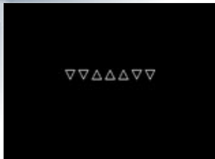
Rys. 4. Przykład obrazu wyświetlanego przez program WST – Test DAUF

Wyniki przeprowadzonych badań pozwalają na uznanie za przydatne w doborze osób do zawodów trudnych i niebezpiecznych następujących testów psychologicznych, pochodzących z Wiedeńskiego Systemu Testów: Standardowe matryce progresywne – SPM, Test wykrywania sygnałów – SIGNAL, Test koordynacji rąk – 2 HAND, Test wydajności pracy – ALS oraz Test ciągłości uwagi – DAUF. Do testów SPM, SIGNAL i 2 HAND [11] wydany został podręcznik zawierający