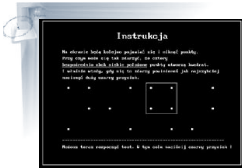
Rys. 2. Przykład obrazu wyświetlanego przez program WST – Test SIGNAL Fig. 2. Screen of the Vienna Test System – SIGNAL test

runkach monotonicznych. Warunki wykonywania testu spełniają bowiem wszystkie następujące kryteria, służące do oceny poziomu monotoniczności środowiska pracy: jednorodność warunków zewnętrznych (cisza w pomieszczeniu, gdzie odbywa się badanie, brak dodatkowej stymulacji), jednorodność wykonywanej pracy (przez cały czas trwania testu wykonuje się to samo zadanie), łatwość wykonywanej pracy wykluczająca konieczność zaangażowania procesów intelektualnych (zadanie polega na obserwowaniu ekranu monitora przez okres około 40 minut) oraz konieczność zachowania ciągłej uwagi (rozproszenie uwagi skutkuje rosnącą liczbą błędów).